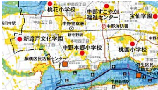
ハザードマップ

ハザードマップでは、浸水リスクの大きさを色で表示しています。（例えば緑や水色、青色のエリアは床上浸水以上の恐れ、地図の●は避難所など。※表記は自治体ごとで異なります）